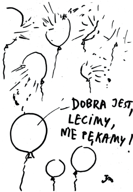
Rys. Stanisław Tym