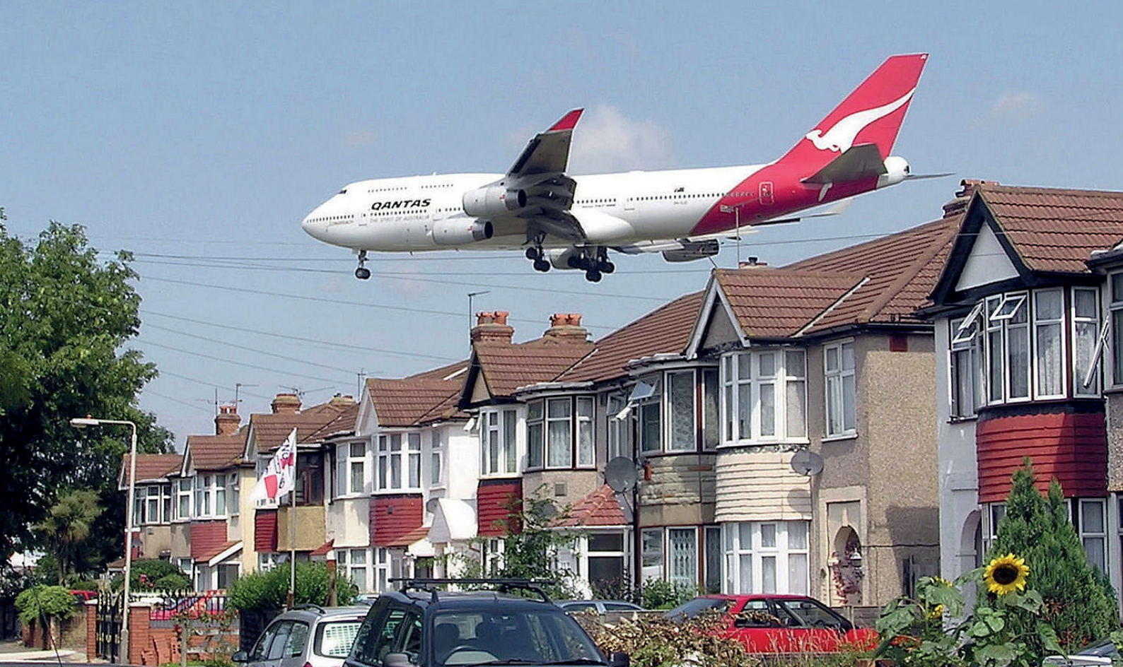
Rys. 1.10. Samolot Boeing 747-400 linii Qantas podchodzący do lądowania na londyńskim lotnisku Heathrow, widoczny nad domami przy Myrtle Avenue, po południowo-wschodniej stronie lotniska