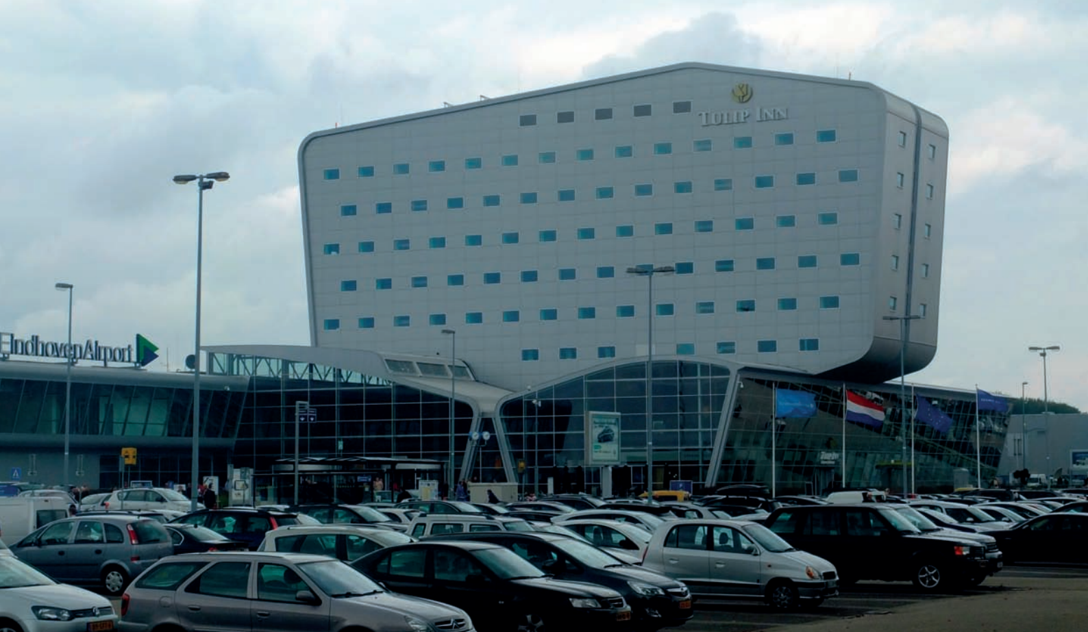
Rys. 1.7. Hotel Tulip Inn nadbudowany na budynku terminalu lotniska w Eindhoven

wynająć kapsułę nawet na kilka godzin snu. Odpowiednio ukształtowane przestrzenie mogą wspomagać dostosowywanie się do zmiany strefy czasowej czy klimatycznej albo dawać możliwość spotkania osób przylatujących z różnych części świata i powrotu bez konieczności przestawiania zegara biologicznego na czas lokalny.