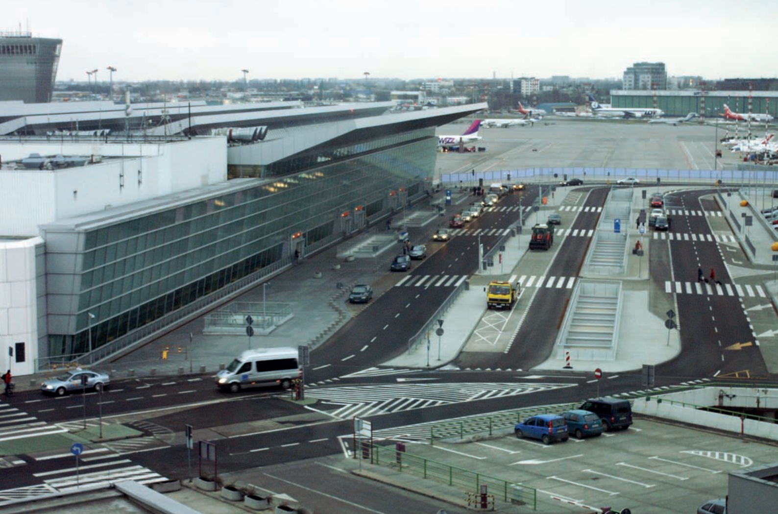
Rys. 1.6. Przykłady rozwiązań komunikacyjnych w portach lotniczych

Powyżej: Strefa przedterminalowa na lotnisku Chopina w Warszawie. Dojazd dla samochodów i autobusów, przystanki autobusowe, postój taksówek, przystanki busów itd.