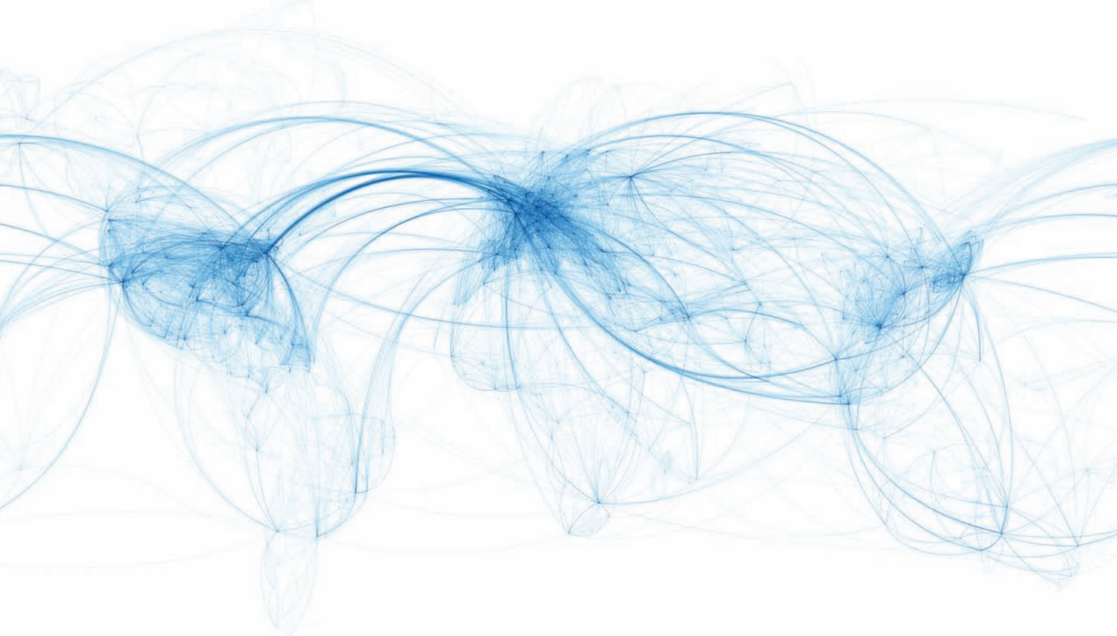
Rys.1.1. Schemat globalnych powiązań w pasażerskim ruchu lotniczym