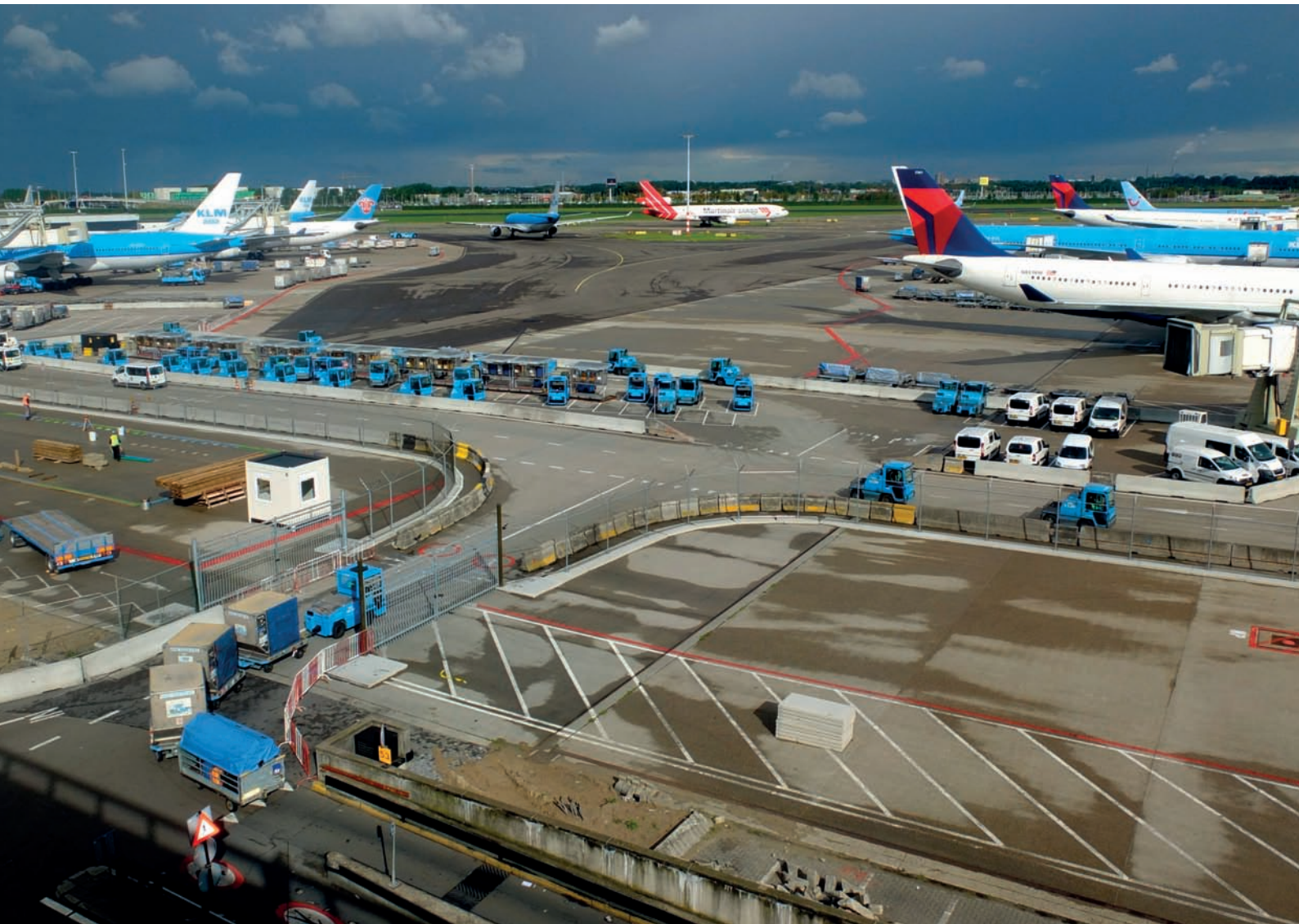
Rys. 1.3. Widok płyty dużego portu lotniczego (Schiphol)