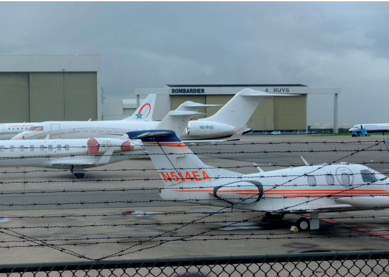
Rys. 1.4. Prywatne samoloty w strefie lotnictwa cywilnego (Schiphol)