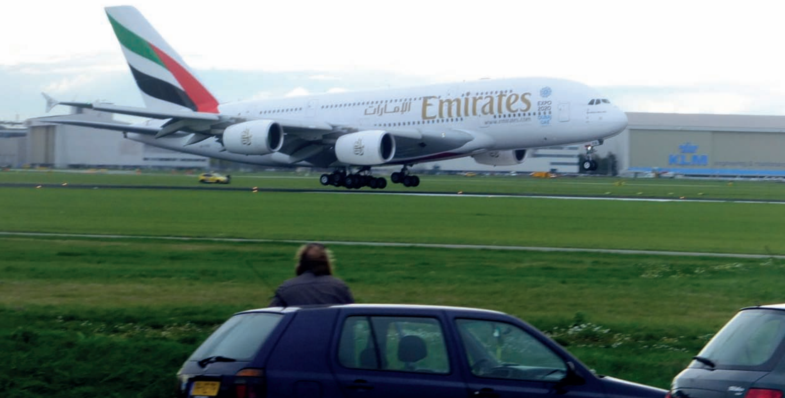
Rys. 1.2. Planespotter na lotnisku Schiphol obserwujący lądowanie największego na świecie samolotu pasażerskiego – Airbus A380 – linii Emirates.

Jednym z przejawów fascynacji lotnictwem jest „planespotting” (ang. plane – samolot, to spot – namierzać) - hobby polegające na obserwowaniu statków powietrznych. Amatorzy najczęściej obserwują i fotografują samoloty pasażerskie w okolicach pasów startowych, a nieraz notują typ i inne dane samolotu.