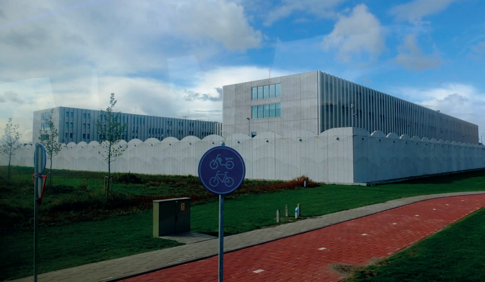
Rys. 1.8. Centrum deportacyjne przy amsterdamskim porcie lotniczym Schiphol. Również dla tego rodzaju funkcji korzystna jest lokalizacja w pobliżu lotniska.

Są to m.in.: handel detaliczny, sklepy wolnoćlowe, banki i usługi finansowe, obsługa komunikacyjna: przystanki autobusowe, dworzec kolejowy, wypożyczalnia samochodów, przystanek taksówek; dodatkowe funkcje w strefie ogólnodostępnej — hotele, kina, muzea, galerie sztuki; kasyna; biura; centra konferencyjne i wystawowe; sport i rekreacja: fitness, spa, bawialnie dla dzieci; usługi medyczne i wellness; kaplice i wiele innych; funkcje związane z obsługą pasażerów: catering, pralnie itp. Istotne pozostają oczywiście nadal funkcje związane zarówno z obsługą samolotów (bazy paliw, serwis), jak i funkcje przemysłowe, w tym logistyka i dystrybucja; cargo, obróbka dóbr szybko psujących się, przemysł lotniczy, specjalne strefy ekonomiczne. Przykładowe, możliwe funkcje rozwijające się w porcie lotniczym i w jego otoczeniu pokazano na schemacie (rys. 1.9).