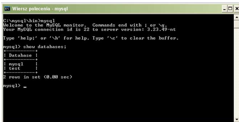
Rysunek 19.2. MySQL Monitor — wygląd ekranu po wydaniu polecenia Show Databases

Jak widać na rysunku 19.2, serwer przechowuje już informacje o bazach danych o nazwie mysql oraz test .