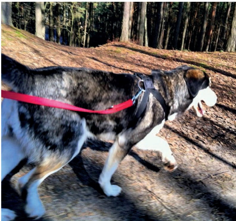
Fot. 67. Gdy wejdzie w tryb biegowy, nie lubi się zatrzymywać