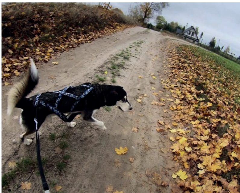
Fot. 69. Biega w używanych do zaprzęgów szorkach, chociaż nie jest psem, który ciągnie. Tak jest mu po prostu najwygodniej

Właściciele psów różnie też postępują z jedzeniem i piciem w czasie biegów. Ja zazwyczaj nie zabieram dodatkowej wody (chyba że wiem, iż teren jest bardzo suchy). Pies podpija sobie z rzeczek i jezior po drodze, dzięki czemu nie ma problemów z nawodnieniem. Zwykle też — jeżeli na trasie jest sklep — nie zabieram jedzenia. W czasie biegu kupuję Łyskowi kawałek — nie za duży — zwykłej kielbasy i bułkę. Jeżeli sklepu ma nie być, zabieram garść psich chrupków. Powiecie: mało. Staram się nie karmić obficie Łyska przy bieganiu, bo może to spowodować np. wykręcenie żołądka. Po biegu natomiast, gdy w perspektywie mamy już tylko spokojny i leniwy wieczór, psu należy się większa niż zwykle kolacja.