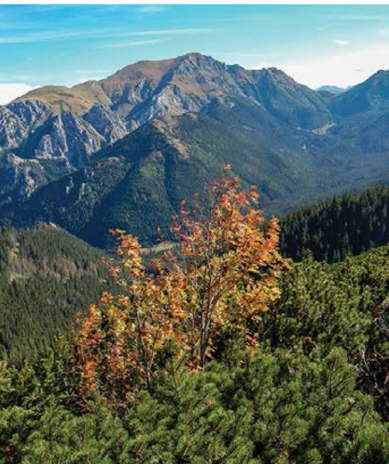
Barwy jesieni – jarzębina w kosodrzewinie

żerują licznie krzyżodzioby szyszkowe i czyże. W żlebach i na ścianach skalnych widoczne są lodospady, na granicach – potężne nawisy śnieżne.