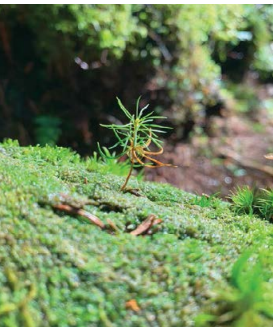
Siewka świerka na kłodzie

metrów od szlaku bez odpowiedniego zbliżenia. Jeśli chodzi o lornetki, to polecamy takie o średnicy obiektywu 40 mm i 10-krotnym powiększeniu. Są one poręczne i w miarę lekkie. Warto wybrać model ze wstrząsoodporną, gumową obudową. Do fotografii przyrodniczej w górach bardzo użyteczne są obiektywy zmiennooogniskowe, np. 200–500 mm lub 150–600 mm, które pozwolą zarówno zrobić zdjęcie makro rośliny, jak i „upolować” ptaka. Dobrze, jeśli obiektyw jest w miarę jasny, bo przy dobrym świetle obejdziesz się bez statywu. Jeśli jednak nastawiamy się na filmowanie, to nie poradzimy sobie bez niego. Ciężki statyw można też zastąpić znacznie lżejszym monopodem. Do oglądania porostów czy minerałów w skale przydatna jest lupa. Trzeba pamiętać, że sprzęt optyczny często sporo waży i plecak z kilkoma obiektywami oraz statywem to kilka dodatkowych kilogramów, które trzeba będzie dźwigać. A musi się w tym plecaku zmieścić prowiant, picie, ubranie, apteczka i reszta wyposażenia. Przy dłuższej trasie taki plecak naprawdę cięży. Warto zatem zabrać tylko najpotrzebniejszy i w miarę możliwości lżejszy sprzęt.