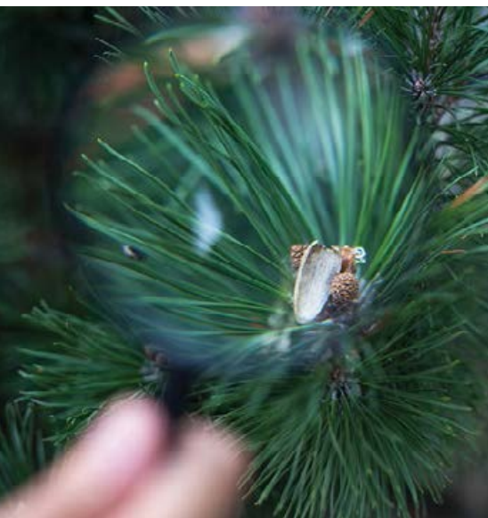
Pędy kosodrzewiny pod lupą