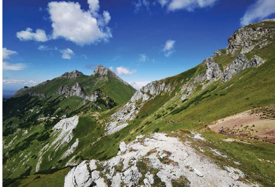
Widok na Tatry Bielskie z Szalonego Przechodu

płaszczowinę cząstkową Hawrania. Płaszczowina Hawrania ma budowę monoklinalną, o warstwach skalnych silnie wychylonych ku północy z jednym wyraźnym skrzyśnięciem obserwowanym w górnych częściach płaszczowiny, spowodowanym nasunięciem wyższej jednostki. Płaszczowina Hawrania jest nasunięta z kolei na leżące na południe od niej autochtoniczne warstwy triasowe, pod którymi zalega zlepieniec koperszadzki, a głębiej i dalej na południe jednostka granitowa Tatr Wysokich. Ponad płaszczowiną cząstkową Hawrania nasunięta jest płaszczowina cząstkowa Palenicy, a między nimi dodatkowo mniejsze jednostki, np. łuska Bujaczego. Powstanie płaszczowin na obszarze Tatr wiązało się ze skracaniem skorupy kontynentalnej w wyniku ruchów tektonicznych orogenezy alpejskiej, o czym przeczytać można szczegółowo w dziale poświęconym geologii Tatr.