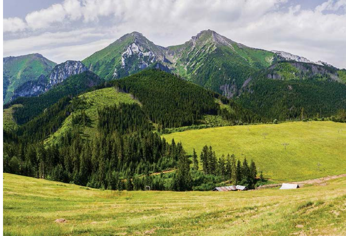
Widok z polany Średnica na Tatry Bielskie

Gwarowa nazwa lilii to leluja. Motyw leluji to jeden z najczęstszych ornamentów na podhalańskich budynkach. Często zdobi on drewniane meble i sosręby. Pojawia się także w haftach na damskich i męskich ubraniach góralskich, głównie serdakach i gorsetach, ale także na koszulach. Do tradycji sztuki podhalańskiej lilia trafiła jednak całkiem niedawno, bo dopiero pod koniec XIX wieku, za sprawą Stanisława Witkiewicza.