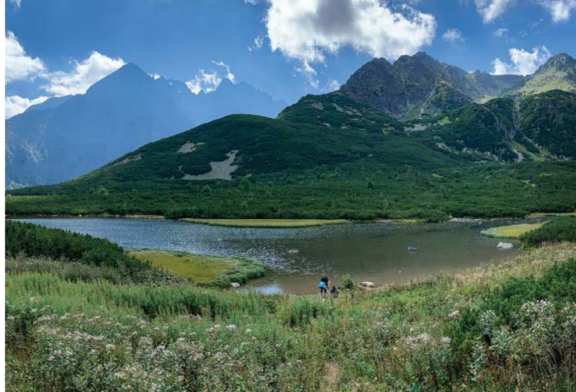
Dolina Białych Stawów Kieżmarskich

górną piętrę Doliny Kieżmarskiej, od Zadnich Koperszadzów – odnogi Doliny Jaworowej. Nazwy tych dolin, zarówno polskie, jak i słowackie (Medódoly), związane są kopalnictwem rud miedzi, które prowadzili w tym rejonie Niemiec-gy górnicy ze Spiszu ( Kupferschächte to po niemiecku „szyby miedzi”). Przełęcz pod Kopą jest jednym z najdogodniejszych przejść przez grań Tatr – przez wieki korzystali z niego pasterze i myśliwi. Nad trawiastymi stokami otaczającymi przełęcz piętrzy się piramidalna sylwetka Jągnięcego Szczytu. Po drugiej stronie rozciąga się panorama najwyższych szczytów Tatr Bielskich z Szalonym Wierchem, Płaczliwą Skałą i Hawranem. Można zauważyć piętrzą budowę stoków.