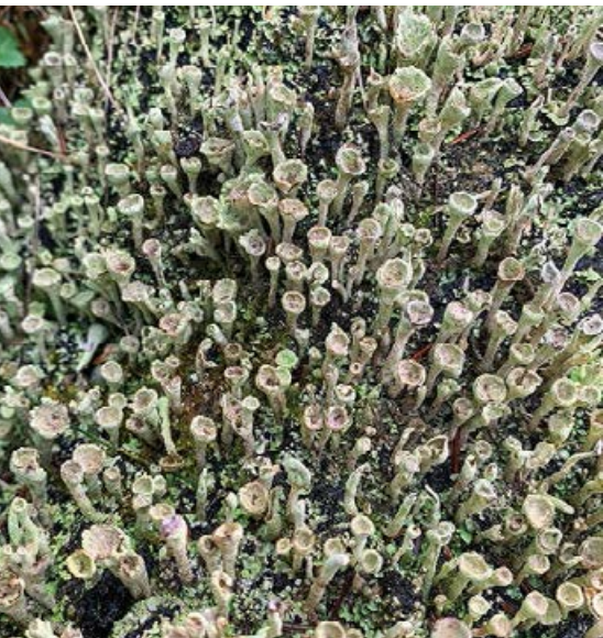
Porosty na kłodzie