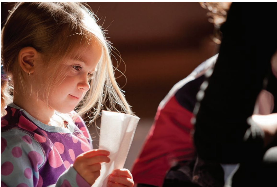
Fotografia 1.3. Nawet gdy intensywnie fotografujesz, dzieci szybko zapominają o Twojej obecności i zajmują się innymi sprawami i działaniami