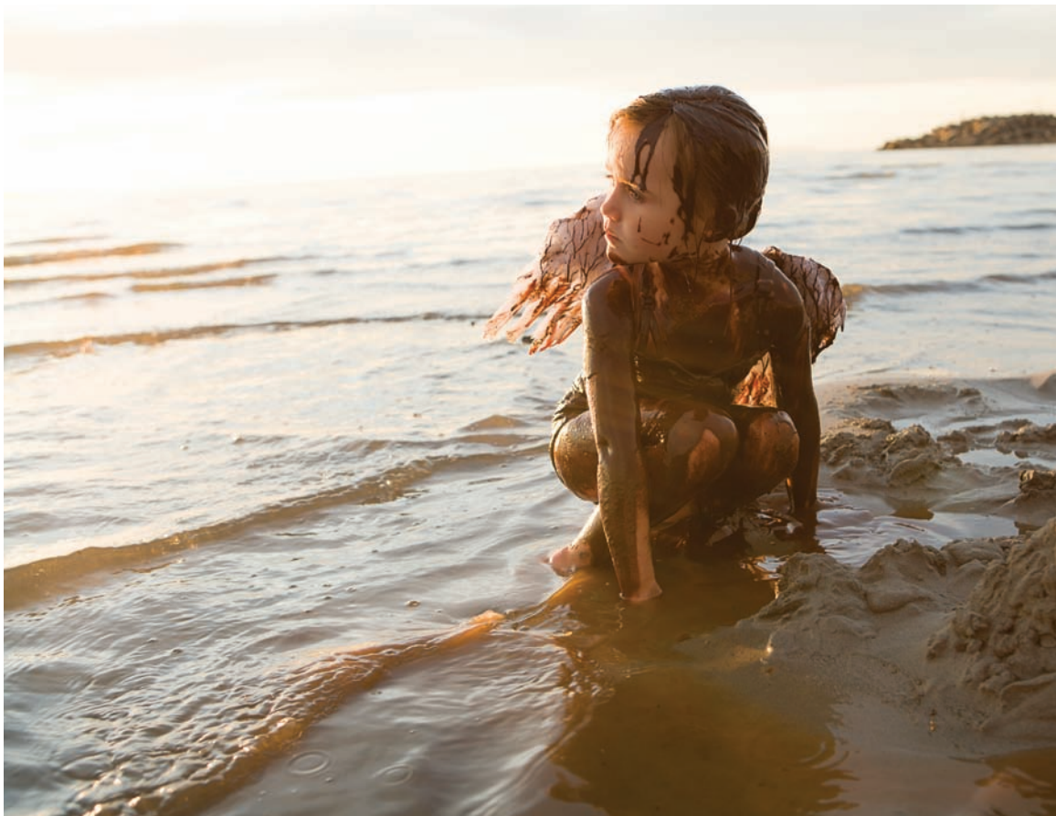
Fotografia 1.12. Poruszając się wokół modela, zmieniasz szybko światło z przedniego na boczne, potem tylne itp. Wraz ze zmianą kierunku światła zmieni się też nastrój fotografii

Czas migawki: 60 Przysłona: f/4,5 ISO: 100 Aparat: cyfrowa lustrzanka Obiektyw: 32 mm Światło: naturalne ze zmiękczonym wypełnieniem fleszowym