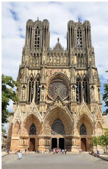
Katedra Notre-Dame

Spacer i przerwa obiadowa w zabytkowej części Lille, zwiedzanie Palais des Beaux-Arts. Nocleg na miejscu (s. 225).