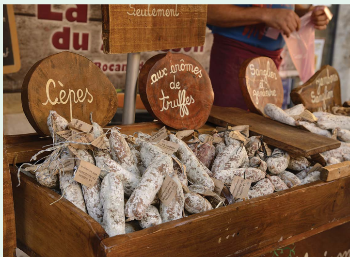
Targ w Sarlat

Najbardziej charakterystyczne jarmarki bożonarodzeniowe odbywają się w regionie Grand Est. Tradycja jarmarków, którym towarzyszą najróżniejsze przedstawienia, koncerty, żywe szopki i wystawy, wywodzi się z krajów germańskich. Od końca listopada do 31 grudnia można się cieszyć magiczną, świąteczną atmosferą. Jeden z najstarszych i najstłynniejszych jarmarków bożonarodzeniowych odbywa się w Strasburgu, który odwiedza wówczas 2 mln turystów. Takie jarmarki organizuje coraz więcej miast i miasteczek, które prześcigają się w oferowanych atrakcjach. Na jarmarkach można kupić dekoracje świąteczne, tradycyjne wypieki i rękodzieło.