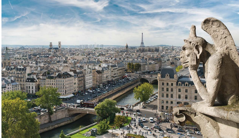
Panorama z jednej z wież katedry Notre-Dame