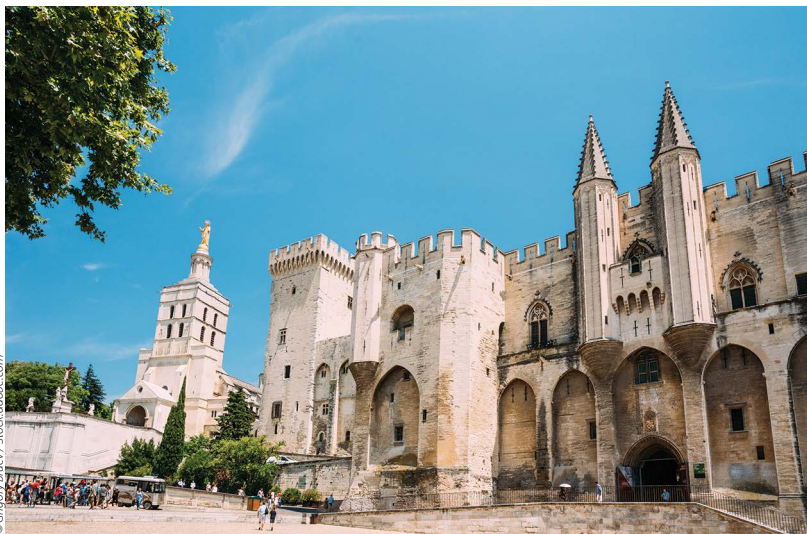
Pałac Papieski w Awinion