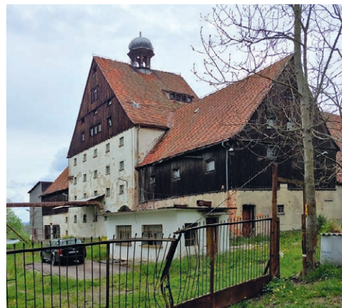
► Dawny młyn w przysiółku Księżno

Wędrując szlakami w okolicach Nowej Rudy, możemy natknąć się na budzący ciekawość charakterystyczny czerwony kolor podłoża. Okoliczne twory geologiczne noszą nazwę czerwonego spągowca, a barwę zawdzięczają m.in. efektowi wietrzenia skał w gorącym i suchym klimacie. Osady te gromadziły się w niecce śródsudeckiej około 270 mln lat temu. Należą do nich m.in. piaskowce, które przybierają kolory od jasnoczerwonego do bardzo intensywnie zabarwionego. Skała jest twarda i trudna w obróbce, ale za to dość odporna na warunki atmosferyczne. Ze względu na te właściwości i niewątpliwe walory dekoracyjne skał tych powszechnie używano w budownictwie. Z utworów czerwonego spągowca zbudowane są m.in. elementy srebrnogórskiej twierdzy, most Zwierzyniecki we Wrocławiu oraz wiele budynków w Nowej Rudzie.