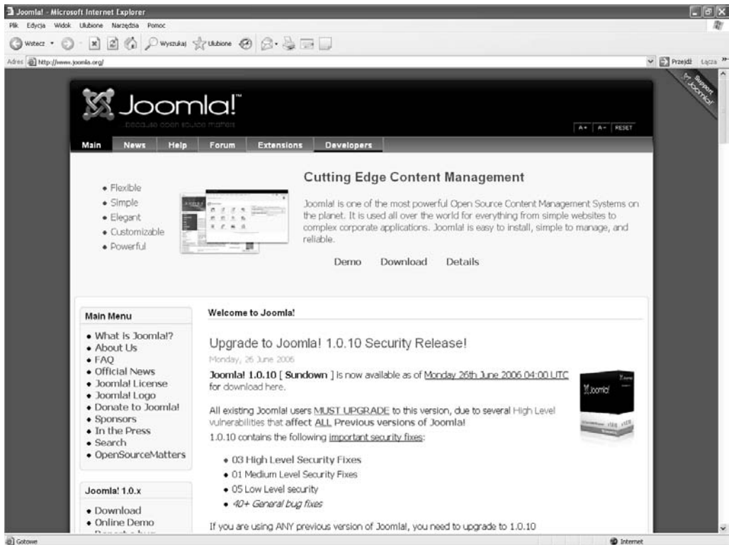
Rysunek 1.1. http://www.joomla.org/

W ciągłym rozwoju Joomla! kładzie się nacisk między innymi na wolność barier. Na stronie Joomla.org można na przykład zmienić rozmiar czcionki tekstu za pomocą jednego kliknięcia myszą (rysunek 1.1).