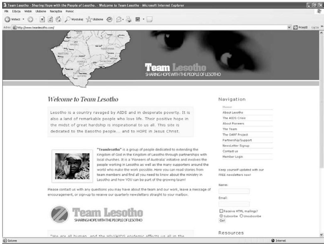
Rysunek 1.5. http://www.teamlesotho.com/