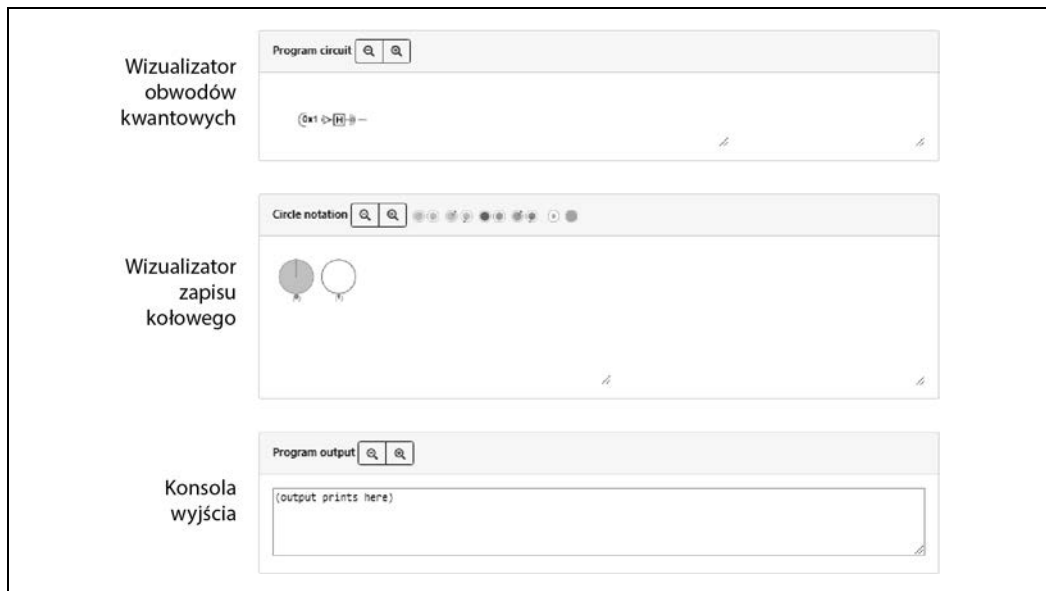
Rysunek 1.2. Elementy interfejsu użytkownika w QCEngine do prezentowania rezultatów QPU