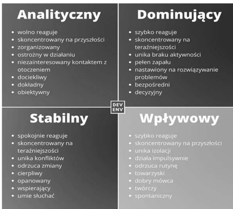
RYSUNEK 5.2. Infografika przedstawiająca kolory charakterów i główne cechy