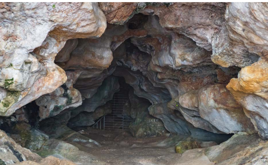
▼ Jaskinia Ghar Hasan