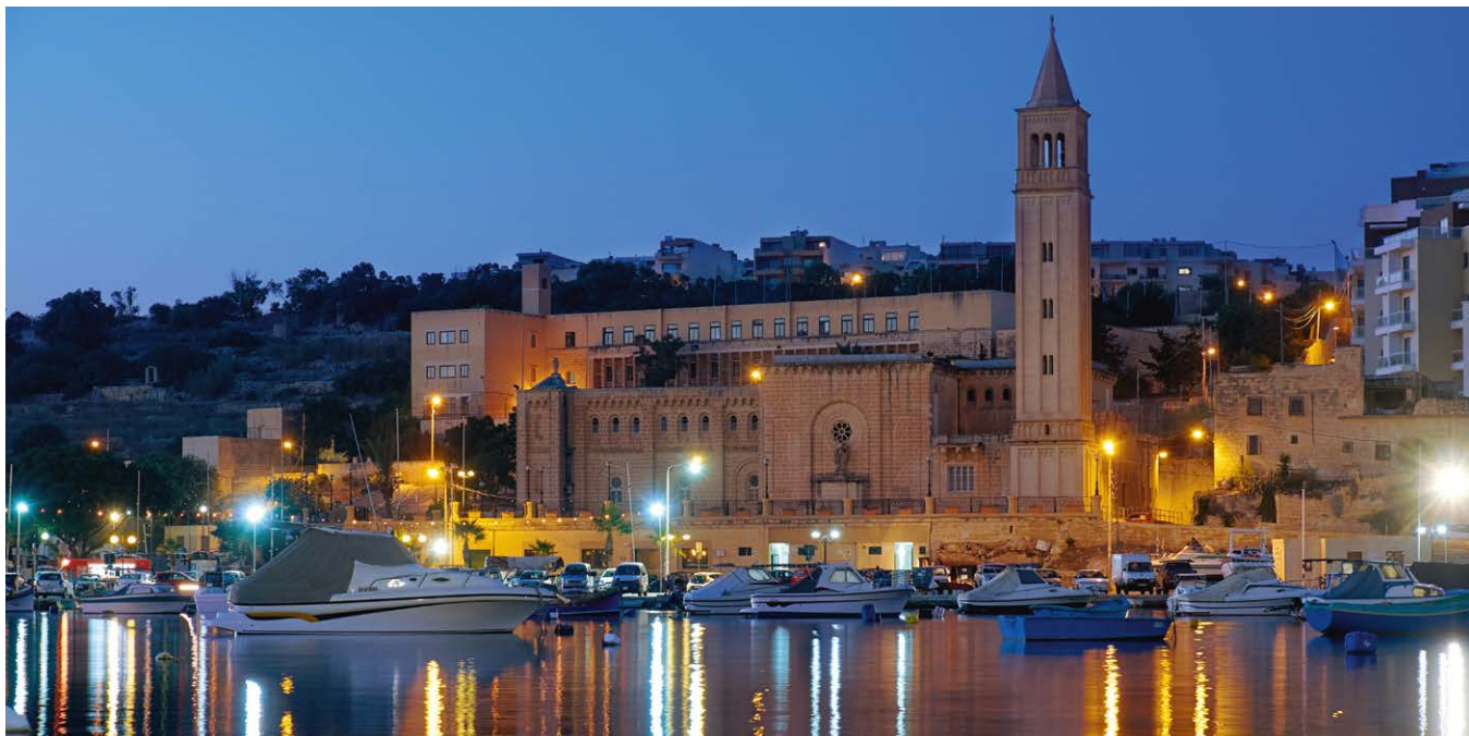
▲ Port w Marsaskali

W XIX w. zamieszkało na tym terenie nieco więcej osadników, być może za sprawą pojawiających się wiosną rzek. Stąd wzięła się nazwa Wied il-Ghajn , używana przez miejscowych do dzisiaj. Oznacza ona