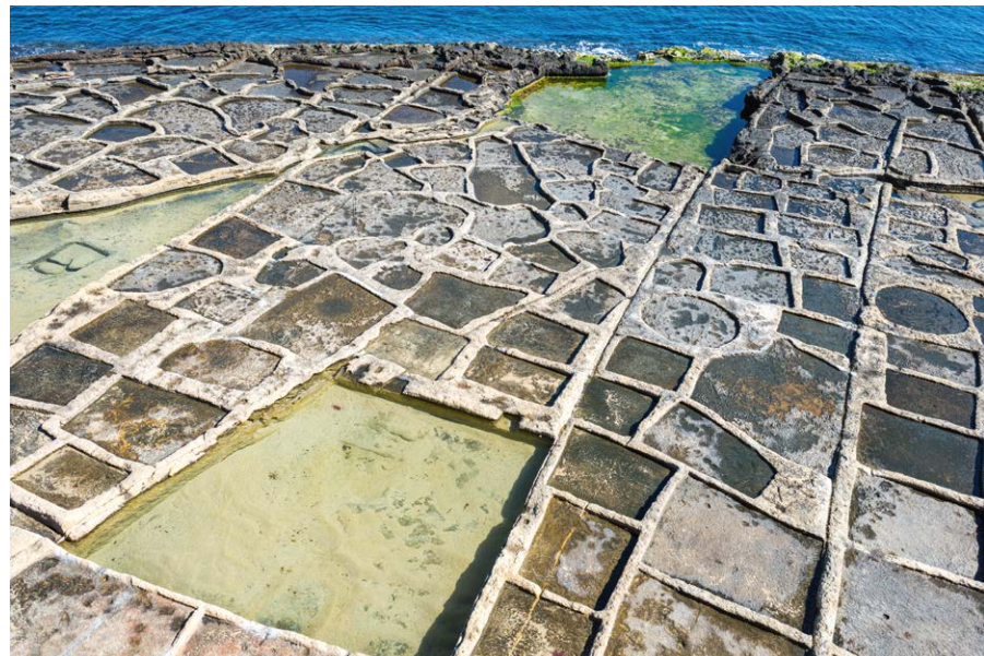
▼ Saliny – płaskie baseny, w których produkuje się sól z morskiej wody w okolicy Marsaskali

Marsaskala była spokojnym portowym miasteczkiem. Ludzie kupowali w tej okolicy letnie rezydencje, a ostatecznie przenosili się na stałe. Wskutek tych przemian miejscowość stała się kurortem, w którym obecnie wznoszą się nowoczesne hotele. Jednak herb miasteczka oraz jego flaga wciąż przypominają o sielankowej przeszłości Marsaskali. Emblematem miasta są dwa zielone trójkąty, tworzące obraz przypominający stromą dolinę, między którymi umieszczono rysunek niebiesko-białych fal. Marsaskala leży bowiem w dolinie, a morze bardzo głęboko wcina się w ląd.