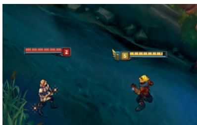
Rysunek 3.1. Lux (po lewej) nie dokonała serii zabójstw, podczas gdy Ezrealowi (po prawej) udało się to zrobić

Jeżeli konkretny bohater dokona kilku zabójstw z rzędu i w międzyczasie nie zginie, to zdobywa tak zwaną serię zabójstw (ang. killing spree ). Z jednej strony pozwala mu to uzyskać przewagę w złocie oraz jest z pewnością powodem do dumy. Z drugiej strony jednak taki czempion jest od tego momentu łakomym kąskiem dla rywali. Za pokonanie postaci posiadającej na koncie serię zabójstw uzyskiwana jest (poza standardowymi 300 sztukami złota) premia, dzielona równo pomiędzy wszystkich członków drużyny. Maksymalnie premia ta może wynosić 90 sztuk złota dla każdego, jeżeli pokonany miał na koncie pięć zabójstw lub więcej. Pokonanie czempiona z mniejszą serią zabójstw przynosi mniejszy zysk. Bohatera, którego zabicie przyniesie nam dodatkowe złoto, możemy rozpoznać dzięki ikonice stosu monet pojawiającej się obok jego paska zdrowia (rysunek 3.1).