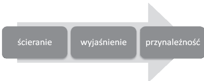
Rysunek 2.1. Proces, efekt i relacje w II fazie powstawania grupy