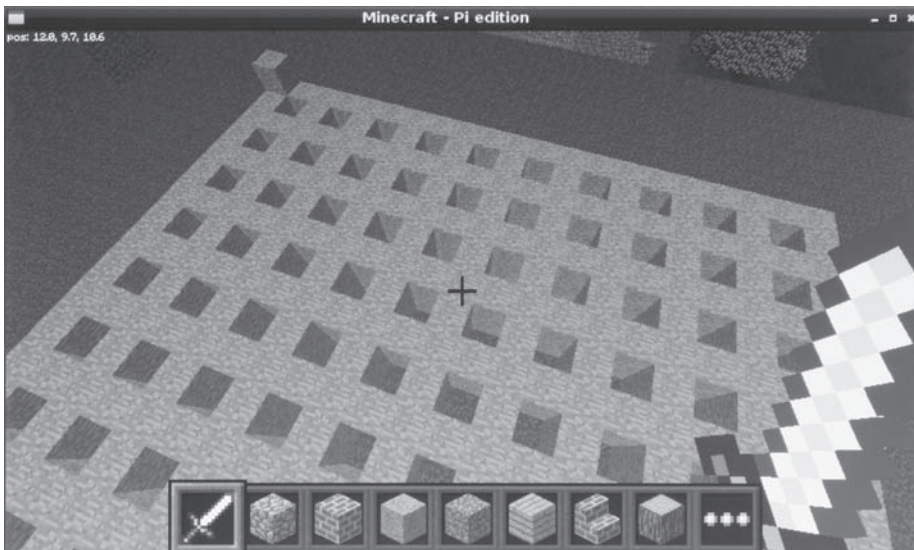
Rysunek 7.3. Siatka w Minecraftcie

Powinieneś uzyskać siatkę wyglądającą tak, jak na rysunku 7.3.