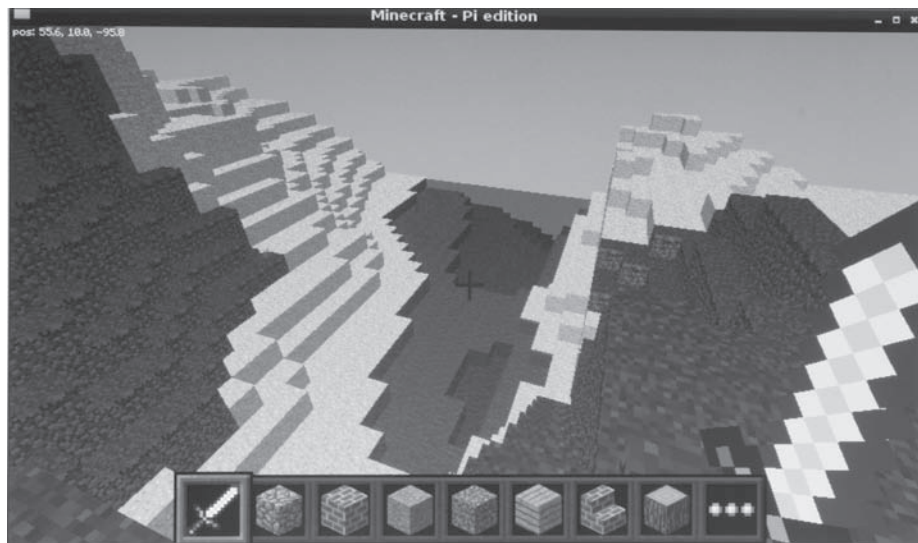
Rysunek 7.1. Microsoft w Raspberry Pi

Kliknij przycisk Start Game , a następnie wybierz opcję Create New . Minecraft wygeneruje wtedy nowy świat z wyjątkowym układem gór, lasów i oceanów. Po zakończeniu tego procesu zobaczysz świat z perspektywy pierwszej osoby (rysunek 7.1).