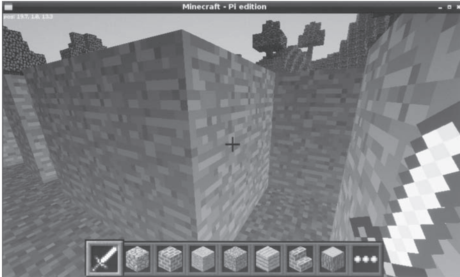
Rysunek 7.4. Znajdowanie drogi w labiryncie

Teraz możesz rozpocząć grę! Rysunek 7.4 przedstawia labirynt od środka.