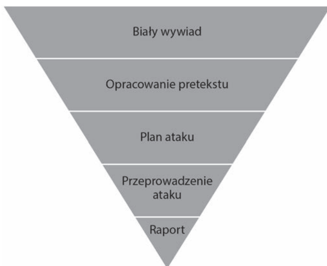
Rysunek 1.3. Piramida socjotechniki

Jak widać, piramida została podzielona na kilka elementów i stanowi ilustrację inżynierii społecznej z perspektywy specjalisty od IS, czyli człowieka, który korzysta ze swoich umiejętności nie po to, by krzywdzić innych, ale aby pomagać swoim klientom.