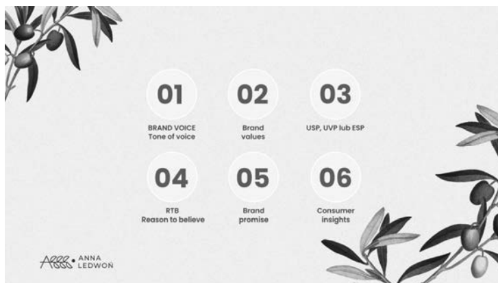
RYSUNEK 2.4. Filary pozycjonowania marki