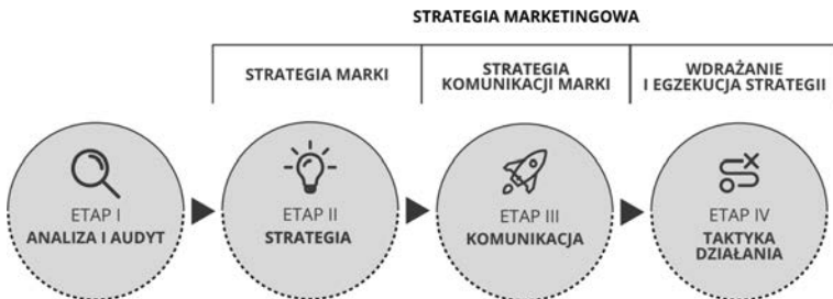
RYSUNEK 2.2. Elementy strategii marketingowej

Tworzenie każdej strategii zaczyna się od procesu analitycznego: audytu i analizy. Następnie mamy etap polegający na tworzeniu strategii marki i etap służący wyborowi sposobu komunikacji marki. Później następuje etap opracowania taktyk działania (rysunek 2.2).