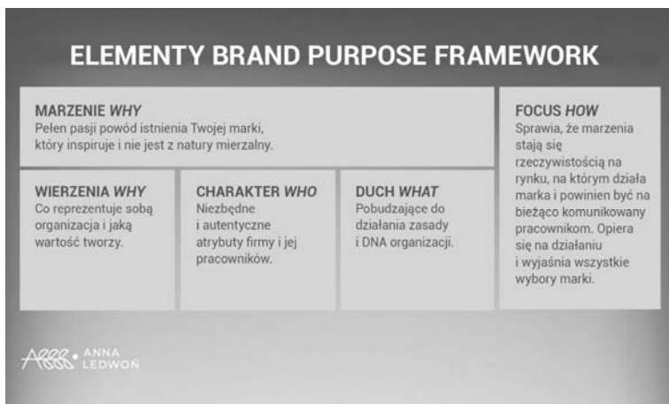
RYSUNEK 2.7. Drugi z frameworków tworzenia brand purpose