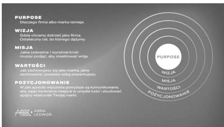
RYSUNEK 2.6. Pierwszy z frameworków tworzenia brand purpose