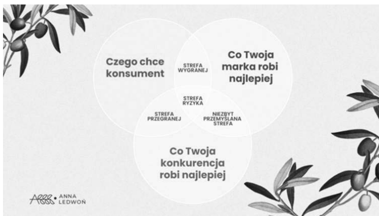
RYSUNEK 2.3. Pozycjonowanie marki