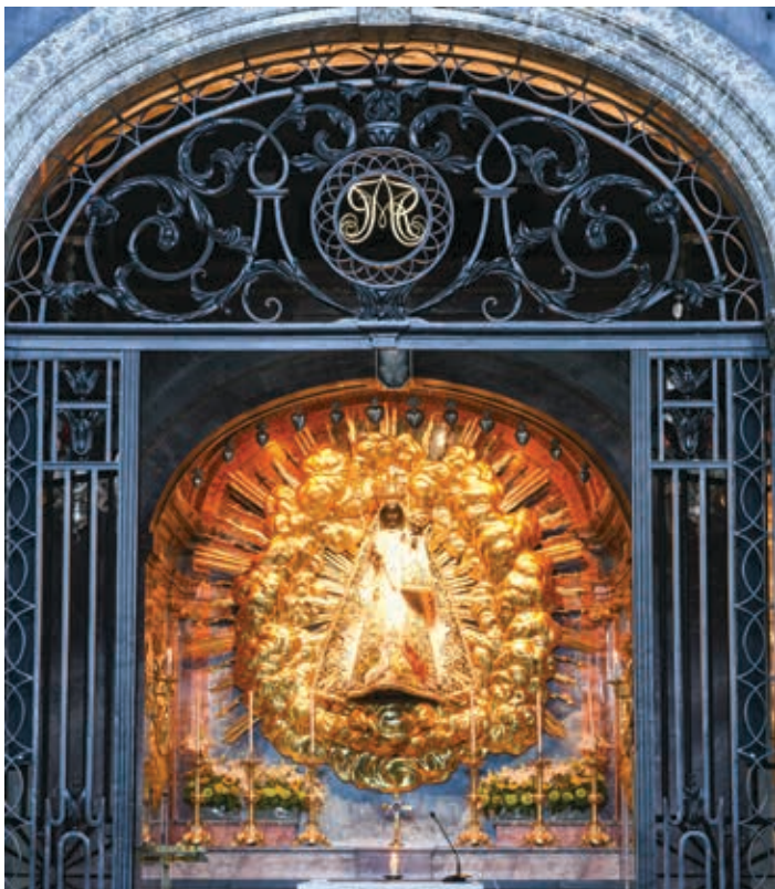
▲ Figura Matki Bożej w opactwie w Einsiedeln