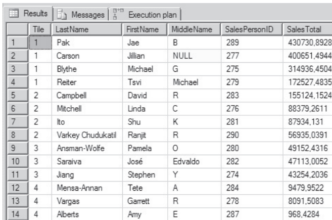
Rysunek 9.11. Sprzedawcy AdventureWorks pogrupowani i uszeregowani za pomocą NTILE

WITH SalesTotalBySalesPerson ( SalesPersonID, SalesTotal ) AS ( SELECT soh.SalesPersonID, SUM(soh.SubTotal) AS SalesTotal FROM Sales.SalesOrderHeader soh WHERE DATEPART(YEAR, soh.OrderDate) = 2013 AND DATEPART(MONTH, soh.OrderDate) = 2 GROUP BY soh.SalesPersonID ) SELECT NTILE(4) OVER( ORDER BY st.SalesTotal DESC) AS Tile, p.LastName, p.FirstName, p.MiddleName, st.SalesPersonID, st.SalesTotal FROM SalesTotalBySalesPerson st INNER JOIN Person.Person p ON st.SalesPersonID = p.BusinessEntityID;