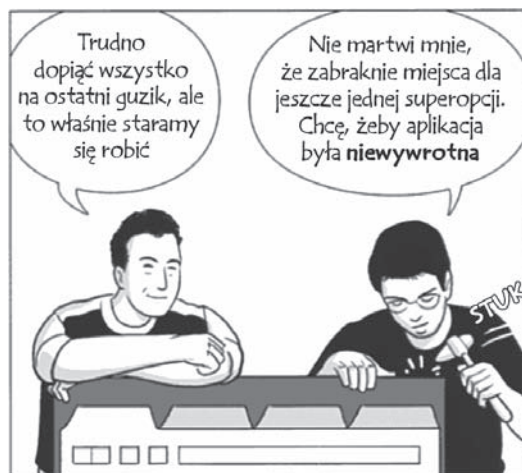
RYSUNEK 1.1. W Google stawiamy na jakość, a nie na wymyślne funkcje