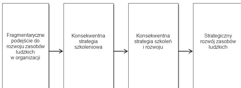
Rysunek 2.2. Etapy rozwoju zasobów ludzkich

Źródło: Walton J. (1999). Strategic human resource development . Pearson Education, 82