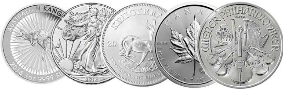
Rysunek 14.2. Najpopularniejsze srebrne monety bulionowe na świecie.

Wśród monet bulionowych ze srebra wymienia się te same monety co w przypadku złotego bulionu. I tak są to: Amerykańskie Orły, Kanadyjskie Liście Klonu, Filharmonicy Wiedeńscy, Australijski Kangur oraz srebrny Krugerrand (rysunek 14.2).