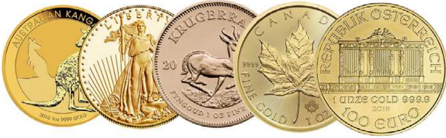
Rysunek 14.1. Pięć najpopularniejszych monet bulionowych na świecie.

Przede wszystkim to, że firma taka poddaje się specjalistycznym audytom, których celem jest sprawdzenie wszelkich aspektów rzetelności produkcyjnej oraz handlowej. Na The Good Delivery List trafić mogą jedynie firmy, których wolumen obrotów jest potężny, a produkty nie pozostawiają nic do życzenia. Firm takich jest w tej chwili jedynie 70, a ich produkty są absolutnie najwyższej klasy, jeśli chodzi o czystość i wagę.