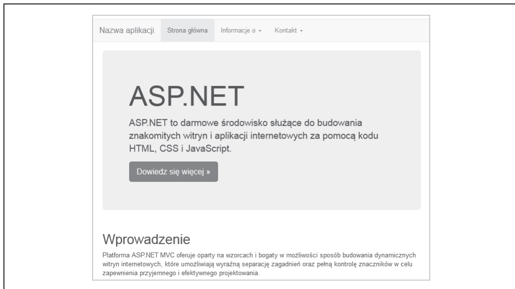
Rysunek 1.2. Domyślna witryna internetowa

public ActionResult About() { ViewBag.Message = "Strona z opisem aplikacji"; return View(); } public ActionResult Contact() { ViewBag.Message = "Strona z informacjami kontaktowymi"; return View(); } } }