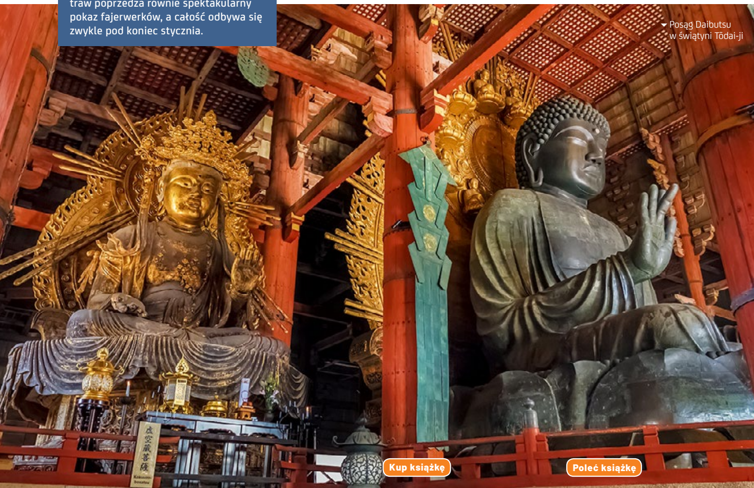
▼ Posąg Daibutsu w świątyni Tōdai-ji

kłanu Fujiwara. W skład kompleksu wchodziło wtedy ponad 150 budowli, z których do dziś zachowała się tylko część. Pięciokondygnacyjna pagoda należy do najwyższych w Japonii (50 m) i jest symbolem miasta. Centralny Złoty Pawilon , odbudowany z rozmachem po pożarze, który strawił go kilka stuleci temu, i Wschodni Złoty Pawilon to dwie największe konstrukcje na terenie świątyni. Ta druga powstała na polecenie cesarza Shōmu, który nakazał jej budowę z intencją uzdrowienia swej chorej ciotki. Muzeum Skarbów Narodowych to jeszcze jeden obiekt z dużą liczbą buddyjskich dzieł sztuki.