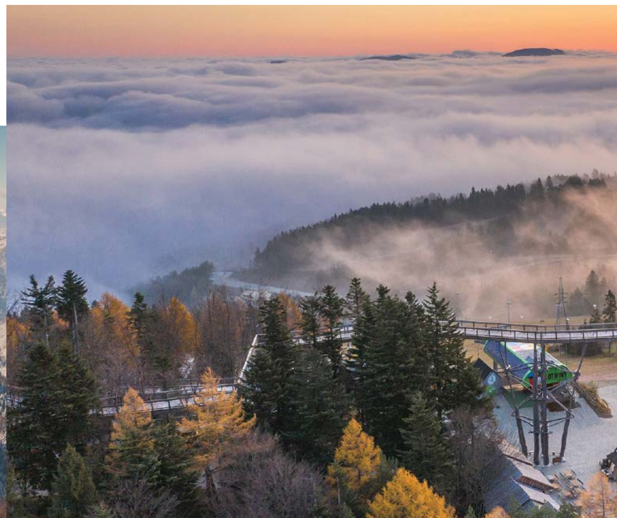
► Wieża widokowa w Krynicy-Zdroju Słotwinach

Dookolna panorama ze szczytu zaburzona jest nieco jego zabudową. Najlepszy płatny punkt widokowy znajduje się obecnie na dachu budynku górnej stacji kolei gondolowej, gdzie w wakacje 2021 r. otwarto najwyższą położoną w Krynicy platformę widokową (8 m ponad gruntem).