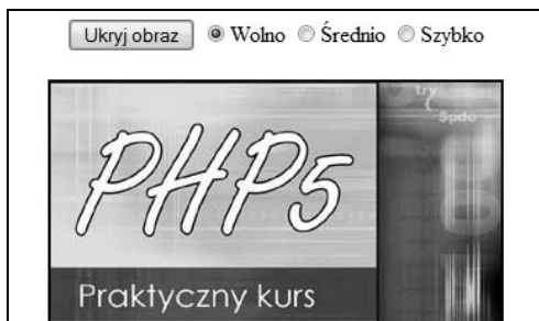
Rysunek 5.2. Wygląd panelu z opcjami z ćwiczenia 5.6

Jej wykonanie spowoduje przypisanie zmiennej speed wartości odczytanej z atrybutu value zaznaczonego pola (ten sposób dostępu do zaznaczonej wartości był już wcześniej wykorzystany w ćwiczeniu 4.11 z rozdziału 4.).